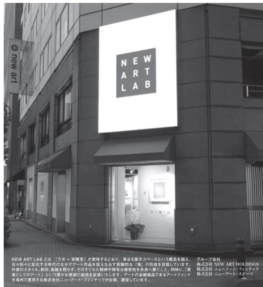
NEW ART LABとは「アホな実験室」が実質となり、異なる展示スペースという概念を越え、日々刻々と変化する時代のなかでアート作品を抱えお守りする「箱」の形態を目指しています。作家のスタイル、新旧、異論を問わず、そのすぐれた精神や稀有な感受性を未来へ繋ぐこと、同時に、「賞金」としての「アート」という豊かな価値を創造いたします。アートの金庫島であるアートファンド株式会社、ニューアート・ファンダクション、ニューアート・ファンダクションを海外で運用する株式会社ニューアート・ファンダクションが、運営しています。