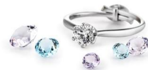
プロポーズリング (シルバー製)